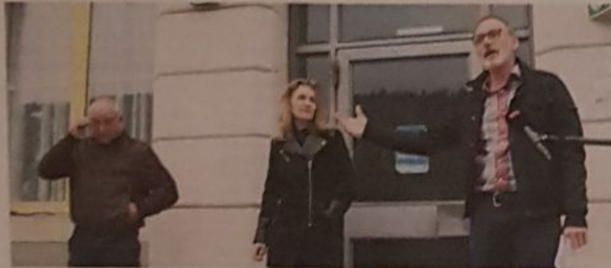
Les résultats très attendus devant la Municipalité de Sonvilier

Ce dimanche 27 septembre, devant la municipalité de Sonvilier, plusieurs habitants et médias se sont réunis pour entendre les résultats des votations