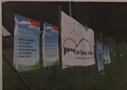
Il n'y aura finalement pas d'éoliennes à Sonvilier

Afin de contribuer au processus de décarbonation et le mise