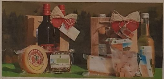
La création du label culinaire Parc Chasseral est l'un des résultats de la collaboration avec les producteurs régionaux

Le développement d'une économie durable est aussi au cœur des projets, avec quelques gageures de taille, comme celle de trouver un meilleur moyen de faire coexister tourisme et transports en commun au sommet du Chasseral, qui est pour l'instant