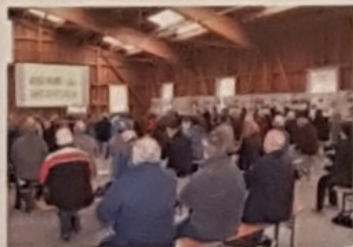
L'Association du Parc Chasseral a tenu son assemblée générale.