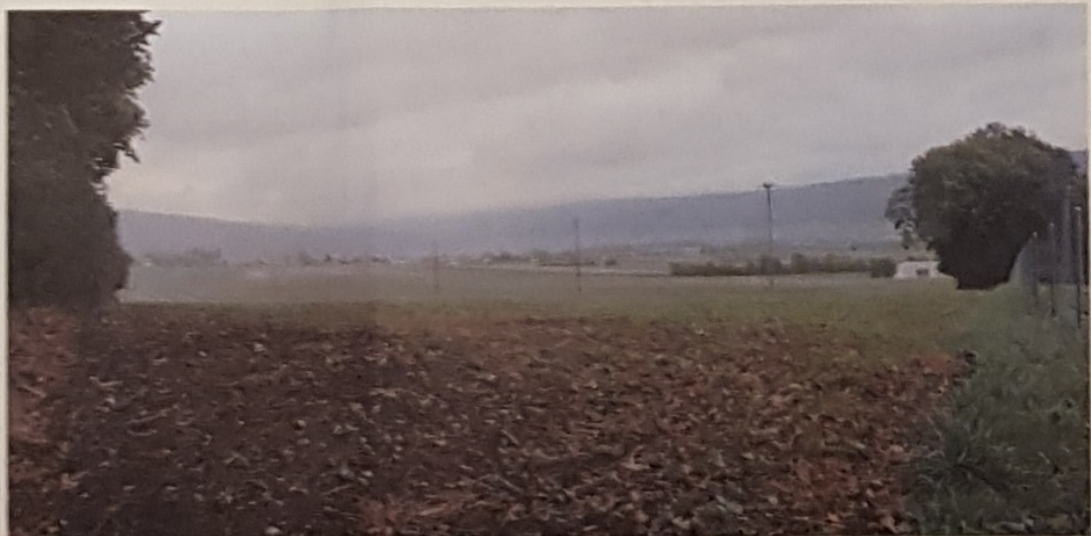
L'implantation du futur centre logistique du Groupe E se fera à cet endroit.

Dans la foulée, et moyennant un amendement de l'exécutif, le postulat déposé par les Verts a passé la rampe: il invite le Conseil communal à exploiter de manière optimale le potentiel photovoltaïque lors de la rénovation ou de la construction de chaque nouveau toit du patrimoine communal. /pif