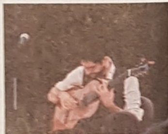
Maïna chante Neruda.