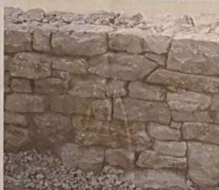
Gros plan sur le mur situé à l'entrée du Pâquier en cours de restauration.

Le Parc naturel régional Chasseral fait partie des territoires d'excellence qui forment les Parcs en Suisse. Il est reconnu par la Confédération depuis 2012. Son but est de préserver et mettre en valeur son patrimoine et de contribuer ainsi au développement durable de la région. Le Parc s'étend sur 38 000 ha et rassemble 21 communes (18 BE et 3 NE) engagées pour une première période de dix ans.