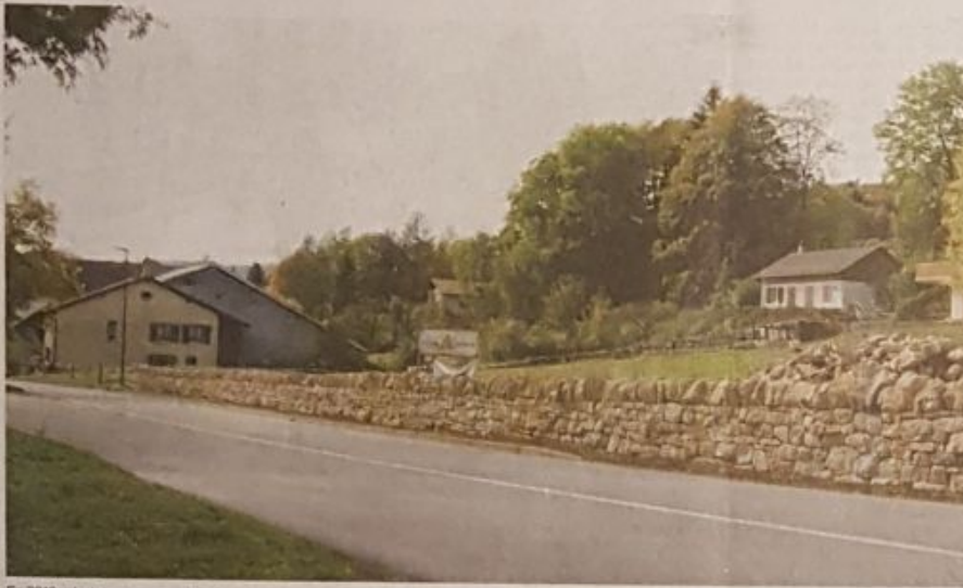
En 2019, plusieurs groupes de volontaires participants à des chantiers nature du Parc Chasseral ont rénové 46 mètres linéaires du mur en pierres sèches à l'entrée du Pâquier.

Deux chantiers de restauration, au Pâquier et à la Montagne de Cernier, battent leur plein. Les muretiers et volontaires ont déjà réalisé cette année plusieurs dizaines de mètres linéaires, mais les pierres viennent à manquer, au risque de mettre en péril les chantiers.