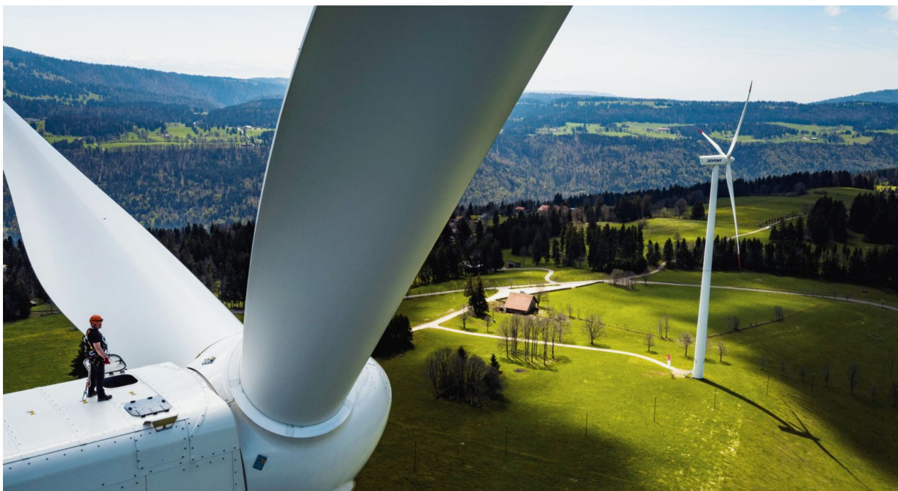
Les éoliennes ont certes un impact sur l'environnement, mais les porteurs du projet des Quatre Bornes ont fait un maximum pour les réduire et apporter des améliorations.

Si Pro Natura, le WWF, Aspö Birdlife et Helvetia Nostra ont