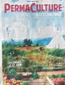
La permaculture fera notamment l'objet d'un film tout public projeté à Sonvilier en mars